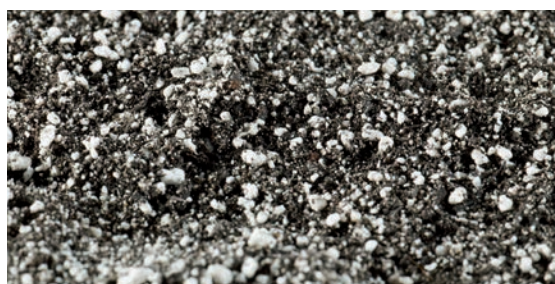
RETERRA®-Perl ist sowohl unter ökologischen als auch unter wirtschaftlichen Gesichtspunkten die perfekte Lösung

Düngung, Wasser- und Luftspeicherung in einem – das ist RETERRA®-Perl. Die Mischung aus gütegesichertem Grünkompost und Perligran gibt der Pflanze, was sie zum gesunden Wachstum braucht: Nährstoffe, Wasser und Luft zum Atmen.