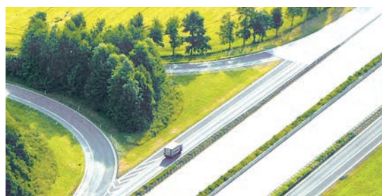
RETERRA®-Perl eignet sich optimal für den Einsatz an extremen Standorten

Sie haben Fragen zu RETERRA®-Perl? Wir beraten Sie gerne!