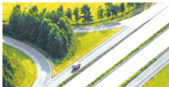
RETERRA®-Perl eignet sich optimal für den Einsatz an extremen Standorten.

Sie haben Fragen zu RETERRA®-Perl? Wir beraten Sie gerne!