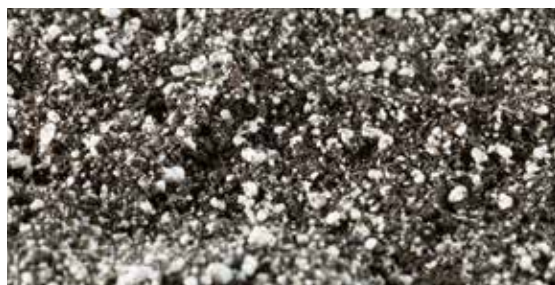
RETERRA®-Perl ist sowohl unter ökologischen als auch unter wirtschaftlichen Gesichtspunkten die perfekte Lösung.

Düngung, Wasser- und Luftspeicherung in einem – das ist RETERRA®-Perl. Die Mischung aus gütegesichertem Grünkompost und Perligran gibt der Pflanze, was sie zum gesunden Wachstum braucht: Nährstoffe, Wasser und Luft zum Atmen.